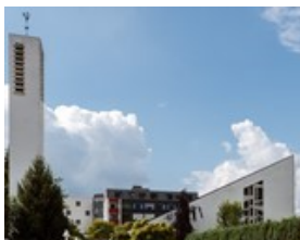
Christkönig Am Hahnberg 10 34537 Bad Wildungen Reinhardshausen