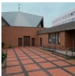
St. Liborius Fürst Friedrich Str. 6 34537 Bad Wildungen