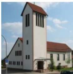
Maria Himmelfahrt Bahnhofstr. 5 34513 Waldeck