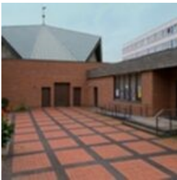
St. Liborius Fürst Friedrich Str. 6 34537 Bad Wildungen