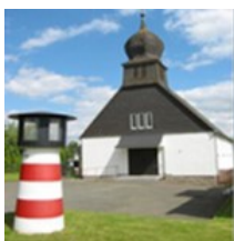
St. Bonifatius Semdenstr. 5 34513 Waldeck Sachsenhausen