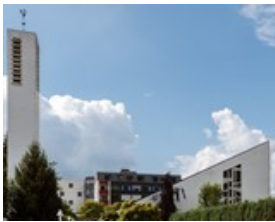
Christkönig Zum Hahnberg 10 34537 Bad Wildungen Reinhardshausen